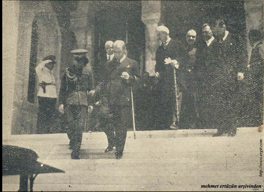
Gazi Hazretleri Kongrenin son toplantılarından birinden dönerken