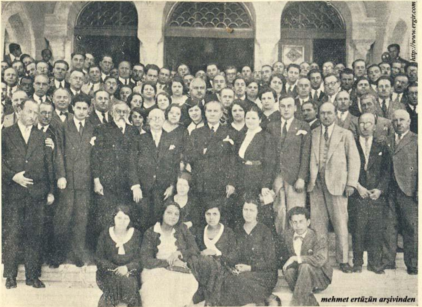
Reisicumhur Gazi Hz. Birinci Türk Tarih Kongresine gelen muallimler arasında